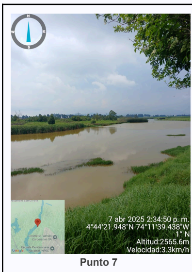
Ilustración 2. Fotos de los puntos del Recorrido de Control Y Vigilancia Ronda Del Humedal Gualí..

C.P 250020 Tel. (601) 8234070 823 40 71 / 823 40 73 Fax. (601) 8257620 Dir. Cra. 14 No. 13-05 03-FR-17 VER.10.2024